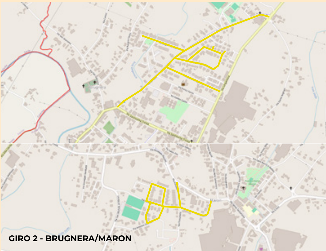
GIRO 2 - BRUGNERA/MARON