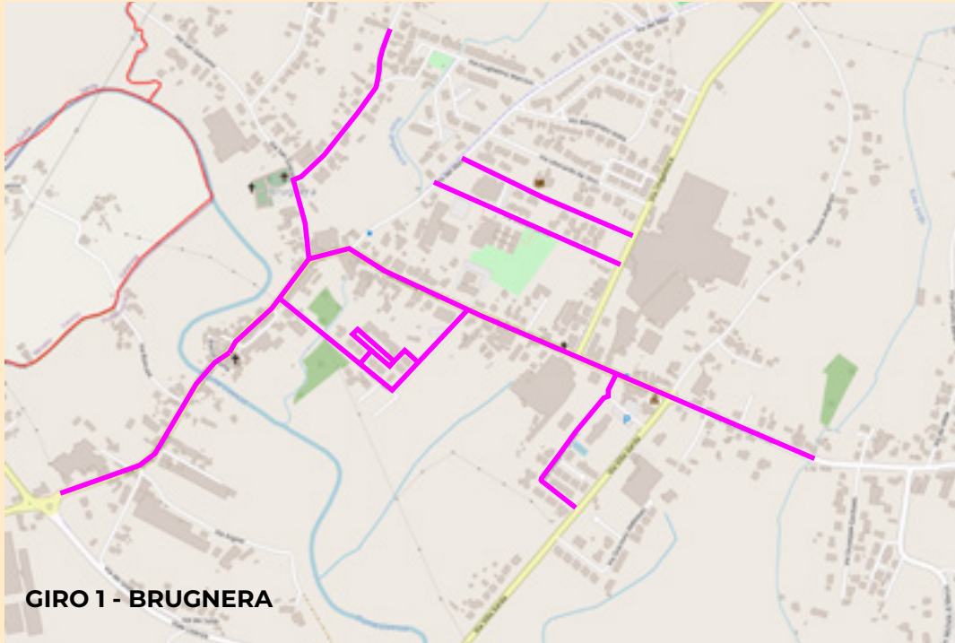
GIRO 1 - BRUGNERA