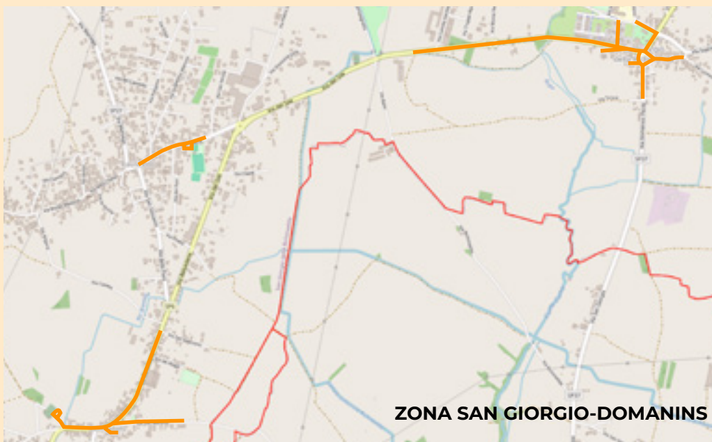
ZONA SAN GIORGIO-DOMANINS